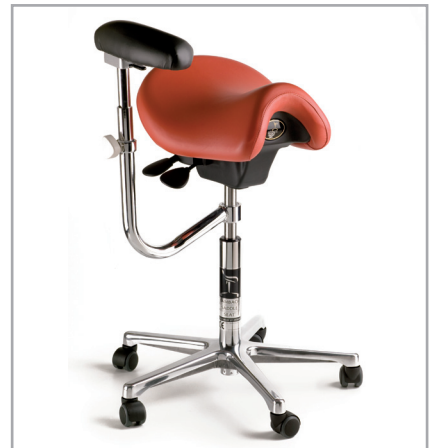
Abb. 4: Der Bambach Sattelsitz (Hager & Werken) ist in vielen verschiedenen Farben und Ausführungen erhältlich und passt somit in jedes Behandlungszimmer.