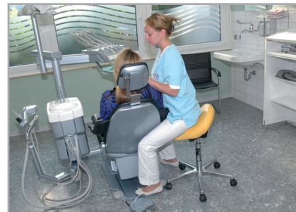
Abb. 1: Die optimale Sitzhaltung mit dem Bambach® Sattelsitz.

Mein Vater hatte sich bereits in den sechziger Jahren des vergangenen Jahrhunderts, als alle Zahnärzte noch