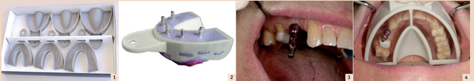
Abb. 1: Miratray Implant für Ober- und Unterkiefer, erhältlich in klein, medium und groß. - Abb. 2: Kompletter Oberkieferabdruck für fünf Implantate mit Miratray Implant nach intraoraler Entfernung. - Abb. 3: Abdruckabutment offener Löffel auf einem Implantat, zweites Prämolare. - Abb. 4: Miratray Implant, eingesetzt zur Demonstration des Abdruckabutments im Löffel mit Abdruck des gesamten Oberkiefers.

Die Methode ermöglicht eine schnelle, leichte, saubere und präzise Positionierung der Implantate. Von Dr. Gregori M. Kurtzman, Maryland, USA.